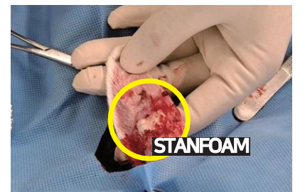
Bleeding Control in 2 min by STANFOAM