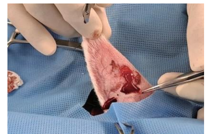
Bleeding on Ear Artery